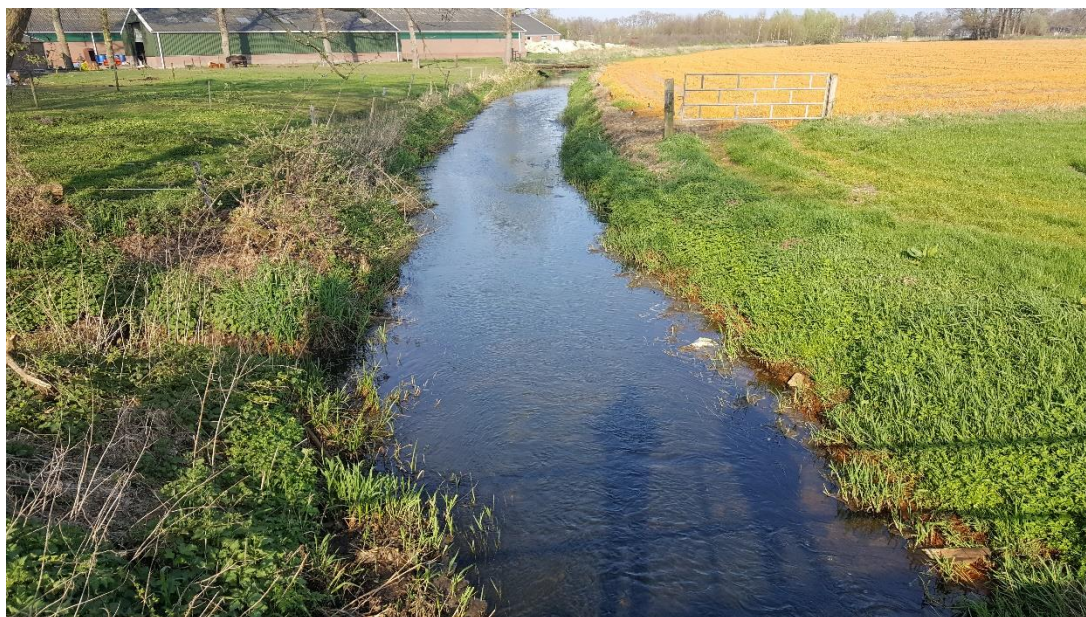
Figuur 4: Foto locatie tijdens veldbezoek op 9 april 2019 (benedenstroomse zijde brug).

Bodembreedte watergang: ca. 4.00 meter Insteekbreedte watergang: ca. 8.50 meter Bodemhoogte: ca. 10.65 mNAP Bereik waterstanden: ca. 10.65 – 11.65 mNAP (??) Bereik afvoer (op basis van maatgevende afvoer): ca. 0-2.3 m 3 /s