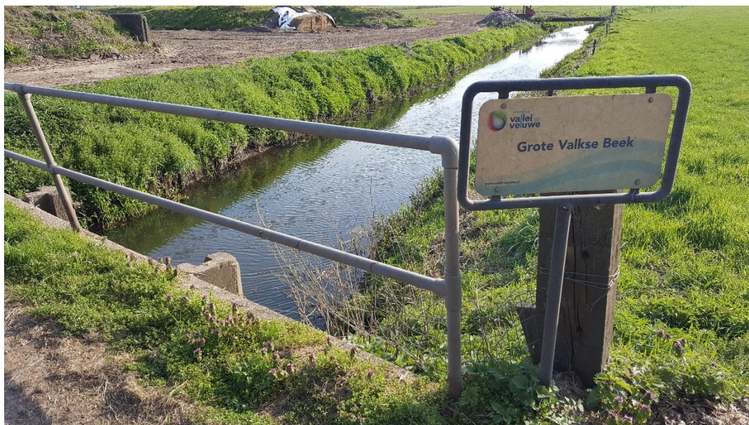
Figuur 2: Foto locatie tijdens veldbezoek op 9 april 2019.