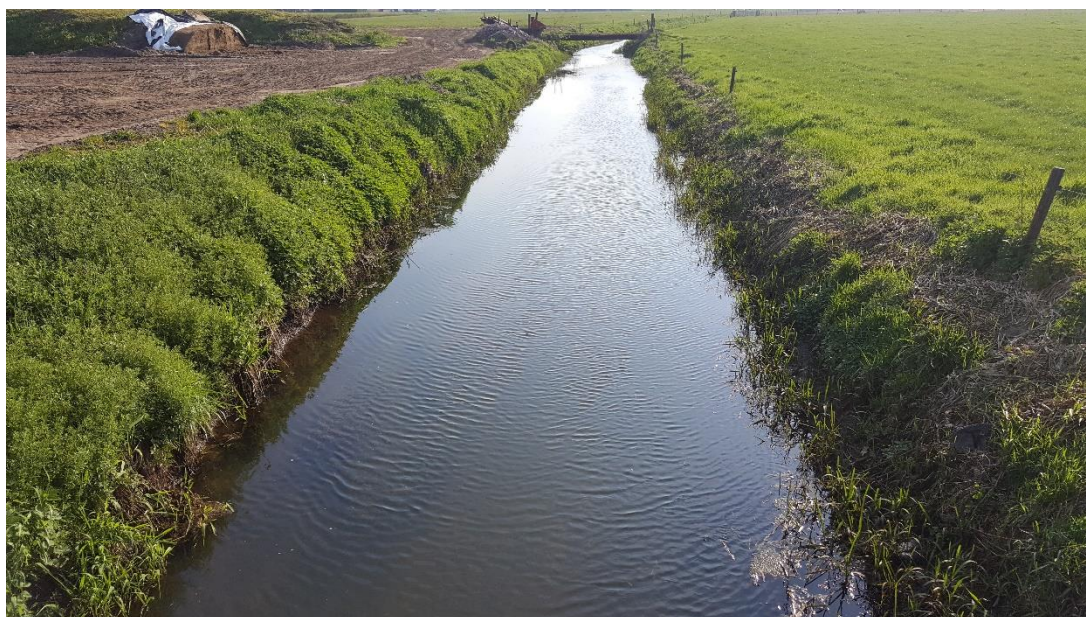
Figuur 3: Foto locatie tijdens veldbezoek op 9 april 2019 (bovenstroomse zijde).